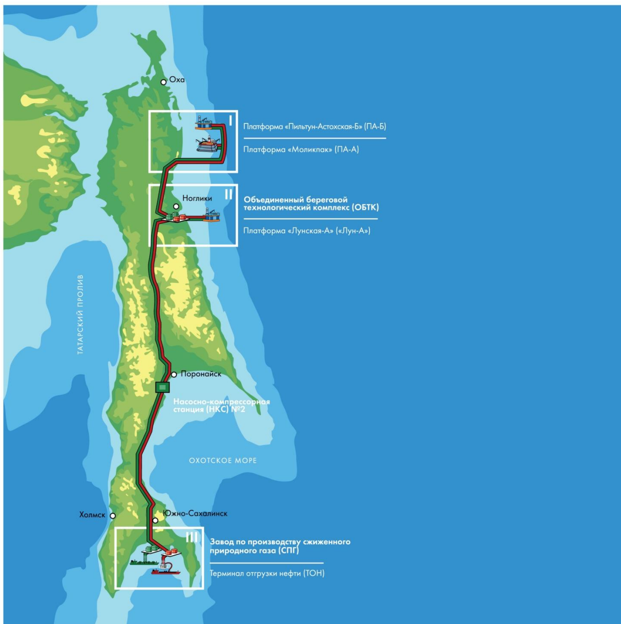
Рис. 1. Объекты проекта «Сахалин-2»

На конец 2011 года персонал компании насчитывал 1932 сотрудника, при этом российский персонал составлял около 87,4%, или 1689 человек. Из общего числа сотрудников на объектах и в офисах на Сахалине было занято 1895 человек, остальные – в Московском представительстве. На сегодняшний день 55,8% персонала – жители Сахалина. Количество персонала подрядчиков, непосредственно работающих для проекта Сахалин-2 составляет более 4500 человек (на конец 2011 года).