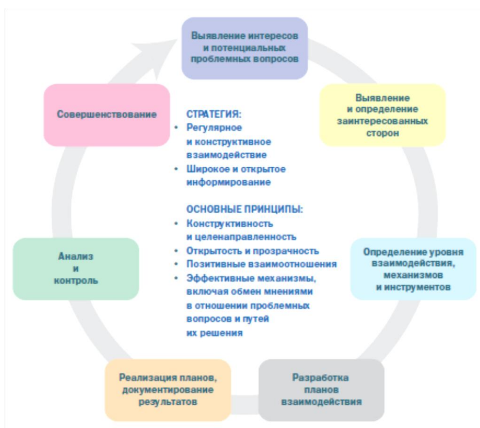
Рис. 3. Процесс взаимодействия с заинтересованными сторонами

Эти документы определяют стратегию, принципы, процесс, механизмы и инструменты взаимодействия и являются доступными для широкой общественности.