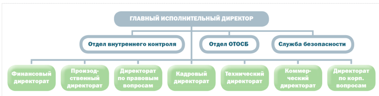
Рис. 6. Организационная структура компании (по состоянию на 31 декабря 2011 года)

Организационная структура компании обеспечивает решение функциональных задач, касающихся как объектов, так и процессов.