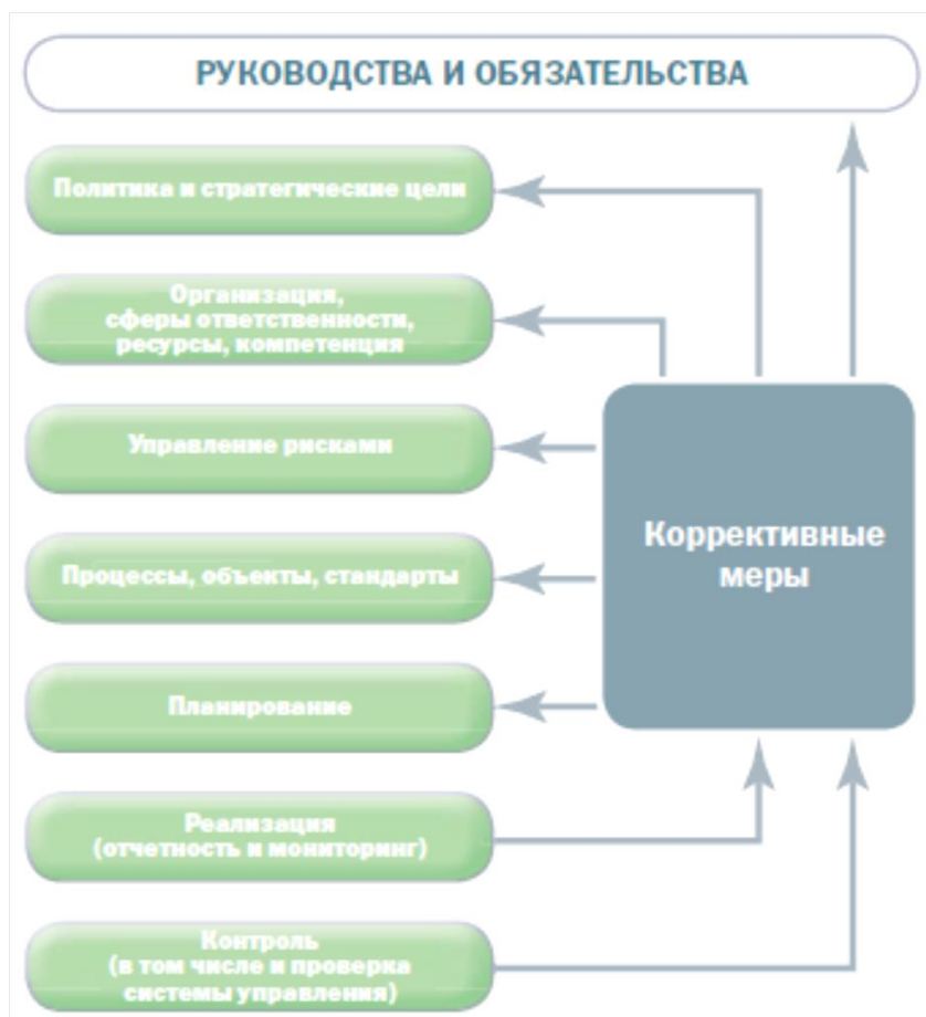
Рис. 4. Система корпоративного управления

Корпоративное управление компании – процесс, обеспечивающий должную организацию, руководство и контроль. Система корпоративного управления является руководством по осуществлению управления деятельностью компании.